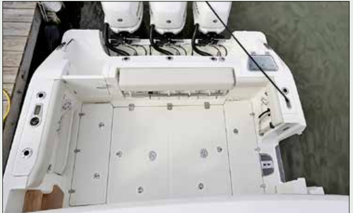
La coupée latérale ravira baigneurs et plongeurs. Elle pallie la difficulté d'accès au cockpit par l'arrière, liée à la présence des trois hors-bord.

ON AIME... L'esprit croisière qui n'oublie pas la pêche, la réalisation et l'équipement de haut niveau.