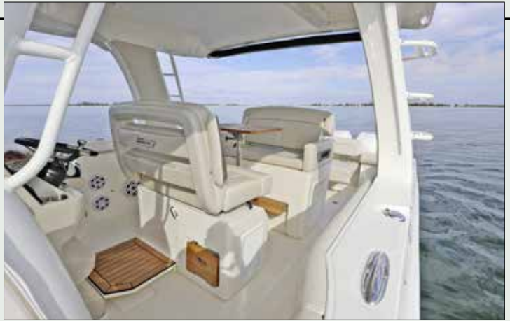
La confortable banquette du poste de pilotage bascule vers l'arrière pour former, avec l'autre banquette et la table, un carré accueillant.

CONSO MOYENNE à 26 nœuds 120 litres/heure